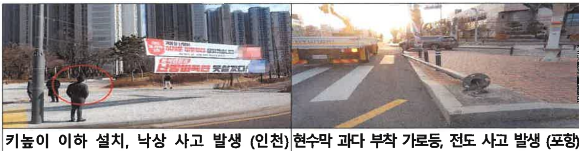
키높이 이하 설치, 낙상 사고 발생 (인천)